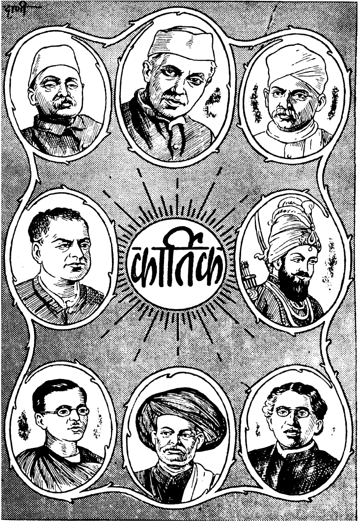
लाला लजपतराय. पं. जवाहरलाल नेहरू. पं. मालवीय. भाई परमानंदजी. गुरु गोविंदसिंह. कन्हैयालाल दत्त. महात्मा फुले. जगदीशचंद्र बोस.